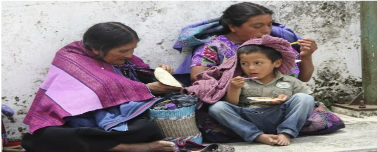
"El Estado mexicano perpetúa la pobreza indígena", Servindi, Consultado en https://www.servindi.org/actualidad/15/11/2016/el-estado-mexicano-perpetua-la-pobreza-indigena , el 9 de diciembre 2021.