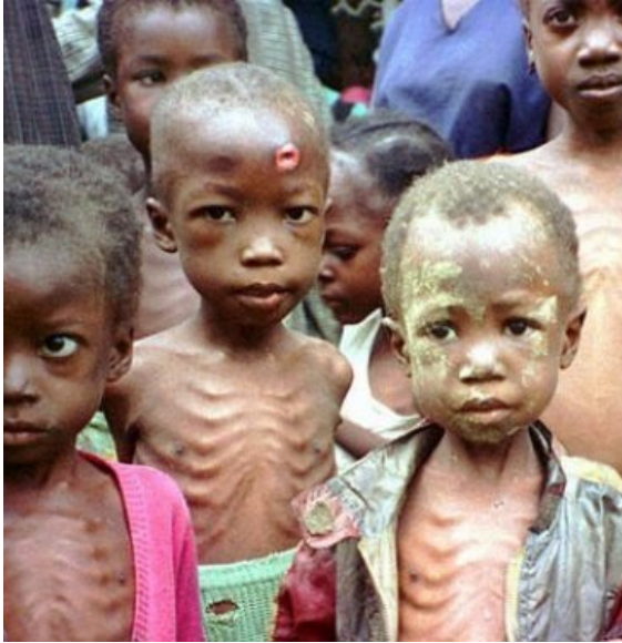
"1,3 millones de niños podrían quedarse sin comida en África", El Tribuno, Consultado en https://www.eltibuno.com/fujuy/nota/2016-8-31-1-30-0-1-3-millones-de-ninos-podrian-que-darse-sin-comida-en-africa , el 9 de diciembre 2021.

América latina y África son dos regiones donde escasea el alimento por razones tan diversas como la guerra, los conflictos armados y la política. Países como Myanmar, Ruanda y Camboya han reducido su tasa de hambruna el 50% tras la estabilización de las regiones y la acogida de una responsabilidad pública y social por parte de sus gobiernos, otros 19 estados han logrado grandes avances en la lucha contra el hambre.