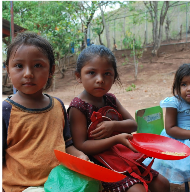
"Para exigir tu derecho a no morirte de hambre debes saber que existe". Hambre y Derechos Humanos. Consultado en http://hambreyderechoshumanos.blogspot.com/2010/11/para-exigir-tu-derecho-no-morirte-de.html , el 9 de diciembre 2021.

Hay una evidente apatía de los Estados que conforman las Naciones Unidas frente a las condiciones de pobreza y desigualdad. Históricamente distintos grupos sociales han peleado por que este derecho sea ejercido por todos y todas, pero siempre se encuentran frente al poder y control de aquellos que respaldan la inequitativa distribución de la riqueza que incrementa el hambre. Como lo son los grandes corporativos y empresas de comida chatarra que se quedan con el dinero al solo ver por sus intereses, sin impórtales las afectaciones hacia el resto de la población haciendo énfasis en como somos afectados en mayor medida niños y niñas.