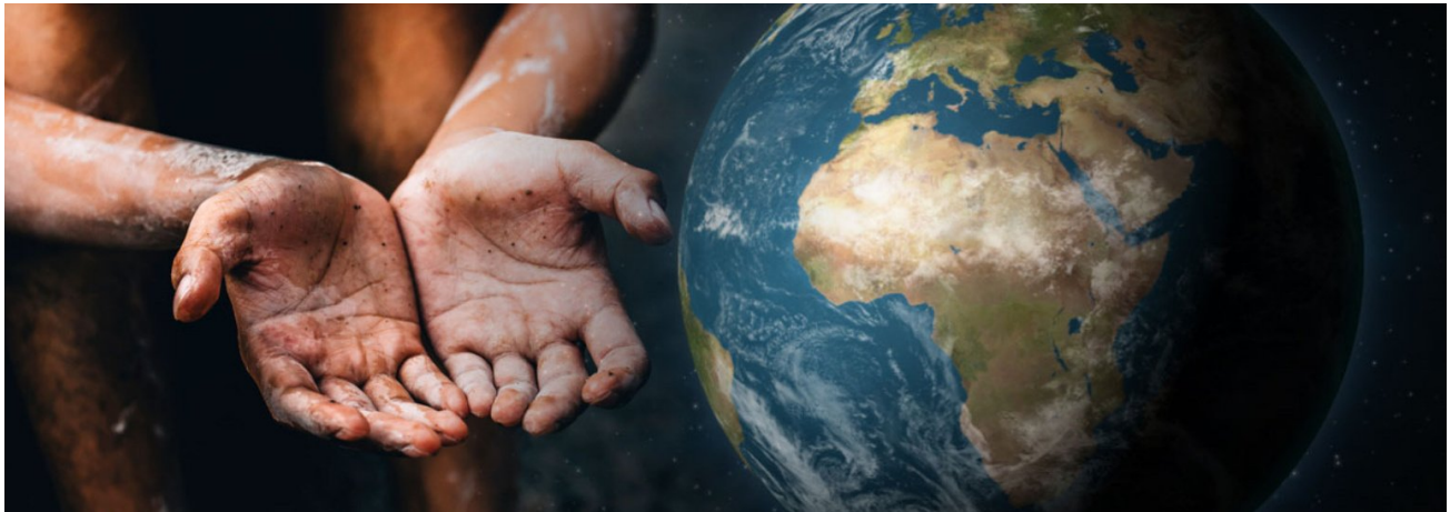
"El mundo retrocede "peligrosamente" en su lucha contra el hambre", La portada, Consultado en https://www.laportadacanada.com/noticia/el-mundo-retrocede-peligrosamente-en-su-lucha-contra-el-hambre/9102 , el 9 de diciembre 2021.

La Organización de las Naciones Unidas (ONU), fundada por 51 países en el año de 1945 tras el suceso de la Segunda Guerra Mundial y cuya fundación es un hecho histórico en el mundo, es